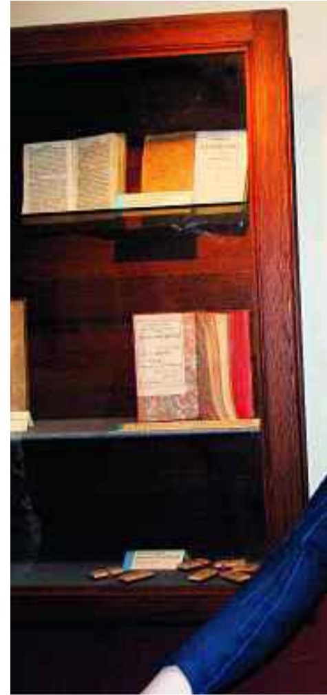
OPPFINNEREN: Voksfigur av Louis Braille