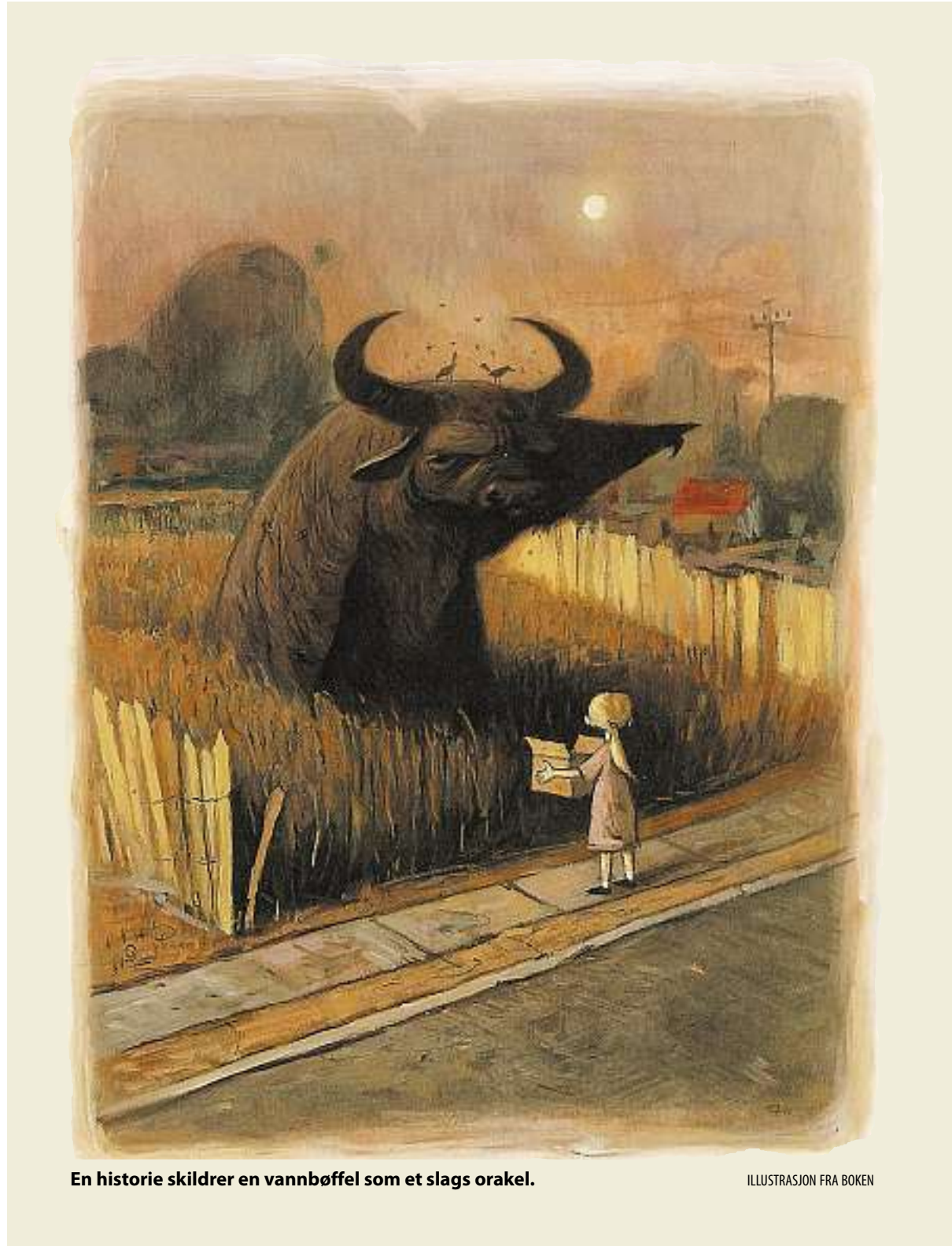
En historie skildrer en vannbøffel som et slags orakel.